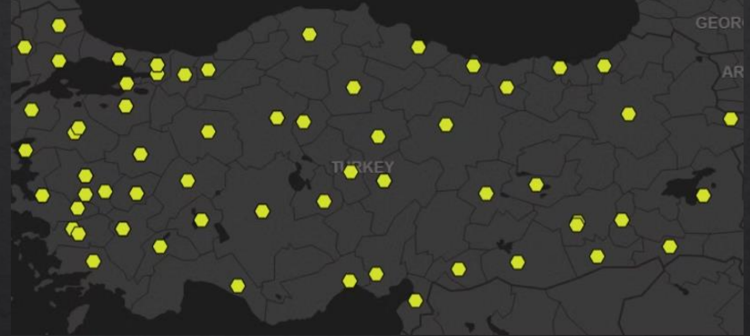
Satışların Bölgesel Dağılımı;

Diğer Muhtelif Gıda Satışları 8.601.451 TL Şeklindedir.